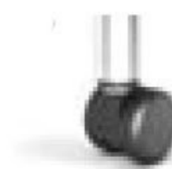
2 of 4 wielen