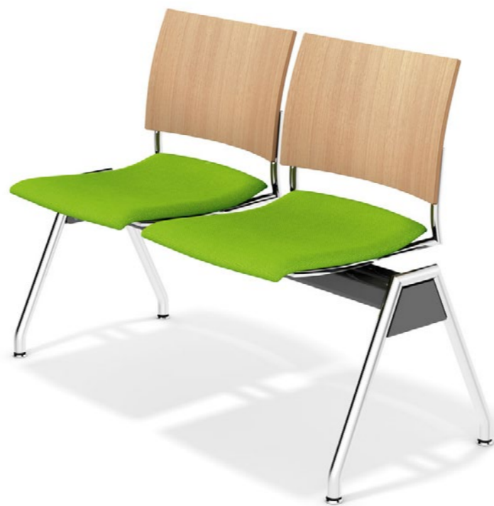
Feniks traverse hout - gestoffeerd - zonder armleggers