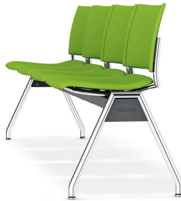
Feniks traverse gestoffeerd - zonder armleggers