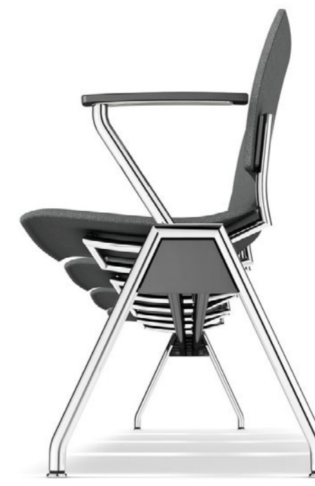
Feniks traverse gestoffeerd - met armleggers