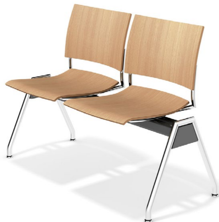
Feniks traverse hout - zonder armleggers