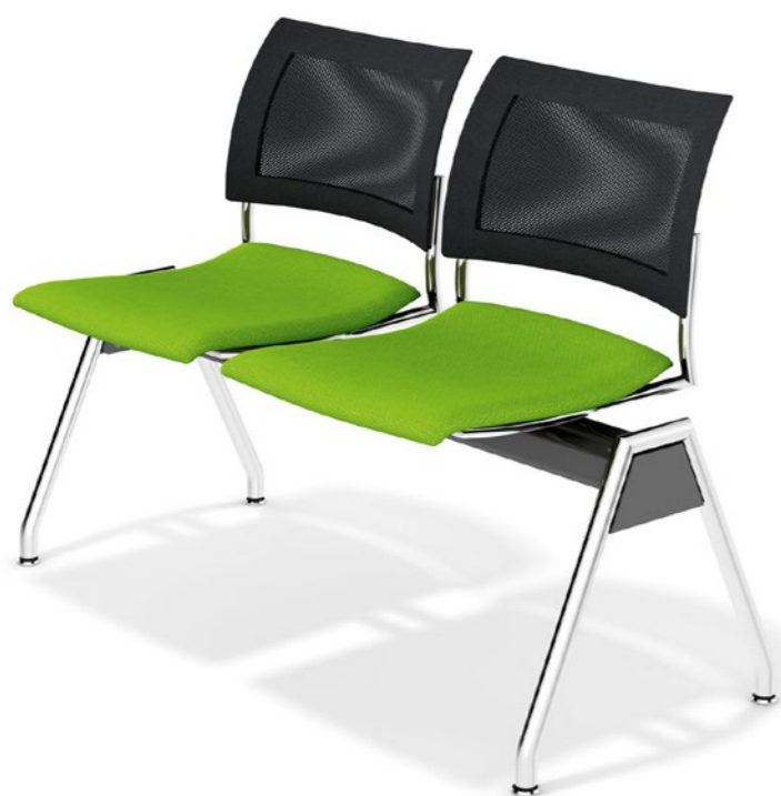
Feniks traverse mesh - gestoffeerd - zonder armleggers