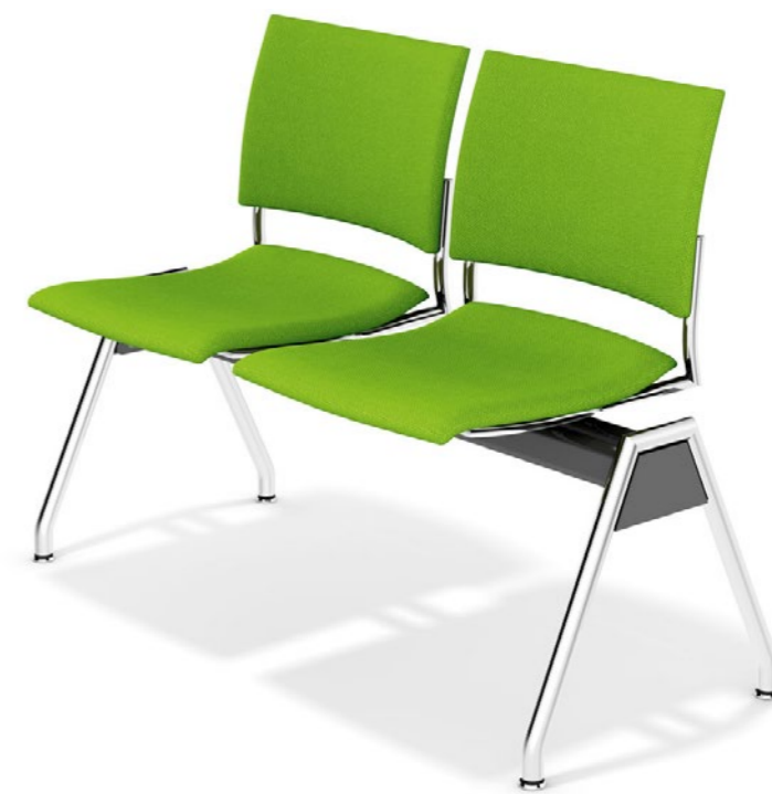
Feniks traverse gestoffeerd - zonder armleggers