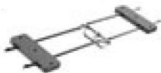
Rijverbinding met paniekvergrendeling