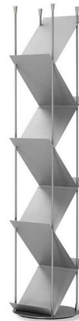
Professional I A4