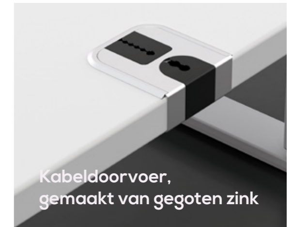
Kabeldoorvoer, gemaakt van gegoten zink