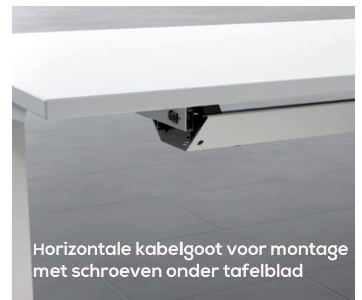
Horizontale kabelgoot voor montage met schroeven onder tafelblad