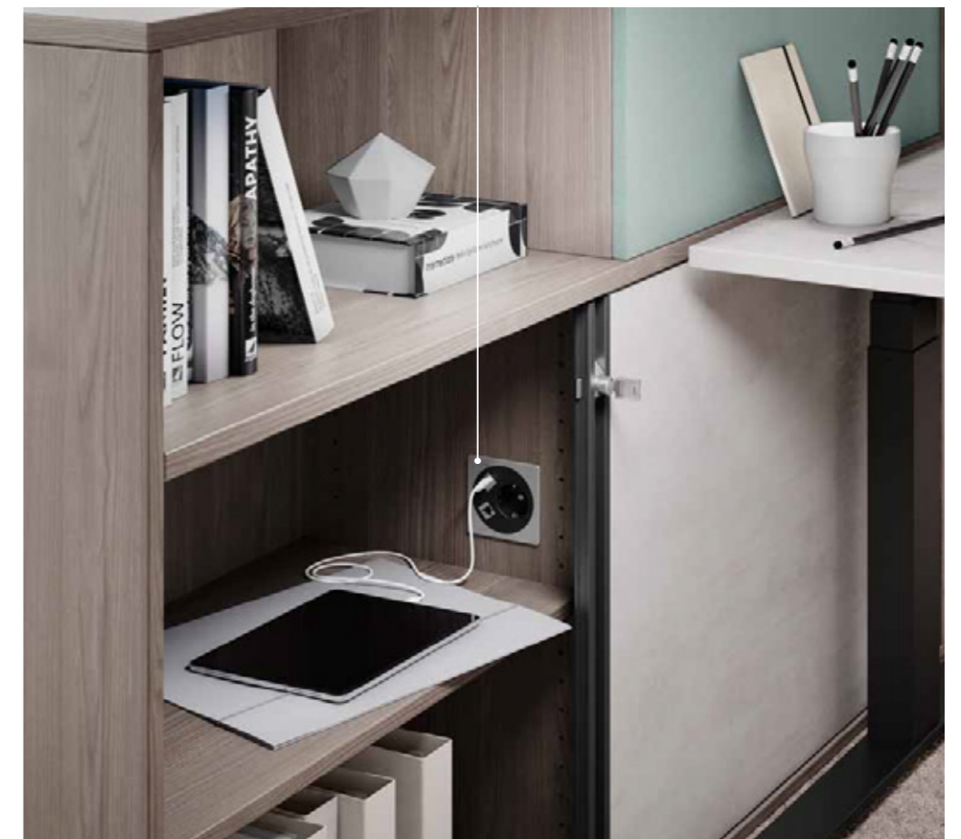
Corpus Piment Essen, frontdecor en bureaublad Alabaster