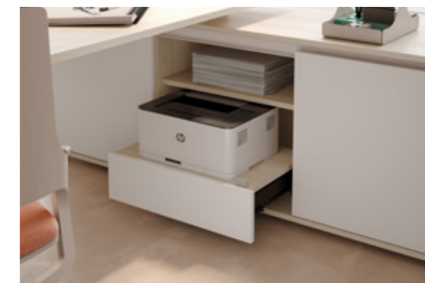
Open vak met printerlade