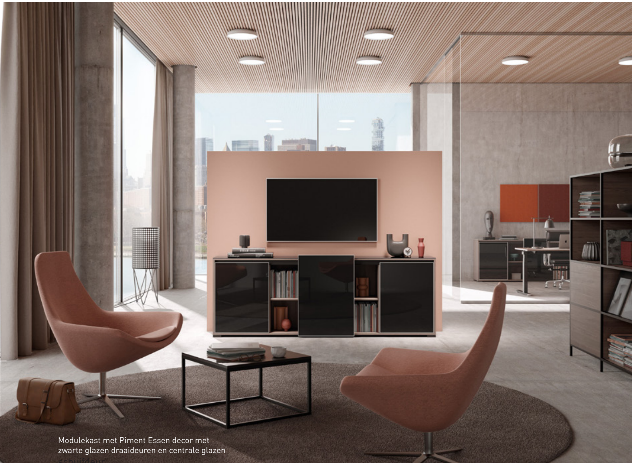
Modulekast met Piment Essen decor met zwarte glazen draaideuren en centrale glazen schuifdeur

Greeploos design – Opbergruimte met stijl