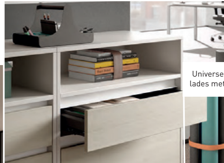
Universele SELECT-kasten met open vak en lades met softsluitering.