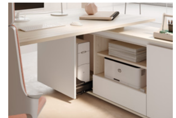
Uittrekbare CPU-lade met front

De combinatie van een SELECT modulaire kast met een samen te stellen bureau voor docking maakt van uw kantoor iets unieks. Het schijnbaar zwevende bureaublad lijkt licht en modern en combineert perfect met SELECT. Onze modulaire kasten zijn verkrijgbaar in vele verschillende maten en uitvoeringen. Ze bieden bovendien ook veel doordachte functies. Zo zorgen de techniek-sideboards ervoor dat de gehele techniek, inclusief alle kabels, onzichtbaar vanaf de vloerdoos door de sideboard en via een kabelgoot naar het bureau kan worden geleid. De modulaire kast is ook geschikt voor computers en printers en biedt ook veel ruimte voor kantoorbenodigdheden, printerpapier en ordners.