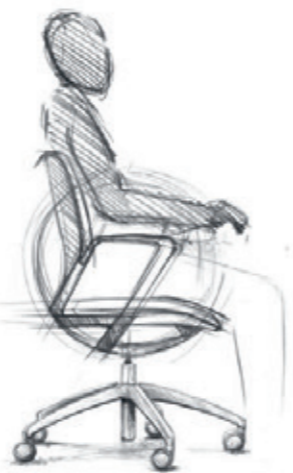
Teekeningen Illustrations: Paolo Fancelli

La Force et le Corps pour les Humans en mouvement. Un siège pivotant est synonyme de mouvement. Sa spécificité réside dans le pivotement et l'oscillation. La forme idéale pour le mouvement, c'est la boule. C'est le seul corps rotatif sans restriction qui conserve toujours une élégance absolue. Même lorsqu'une boule est usinée, réduite par découpage et évidage, la géométrie d'une boule demeure intacte et visible. C'est le cas aussi avec le giroflex 313. La géométrie stricte place l'être humain au centre. Le giroflex 313 est présent, pas dominant. Il est dédié à sa fonction.