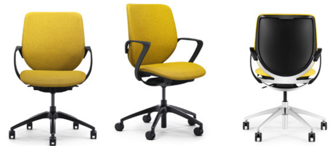
Chair To Share

De giroflex 313 overtuigt met zijn ontwerp en zijn ergonomie. De giroflex 313 is een compacte stoel. Hij maakt indruk zonder op te vallen. De rug is niet al te hoog zodat hij de ruimte niet overheerst maar prima in het geheel past.