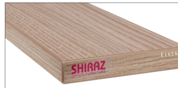
Eiken voelbare structuur