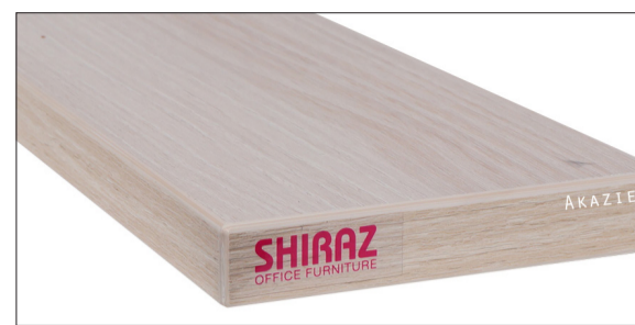
Akazie voelbare structuur