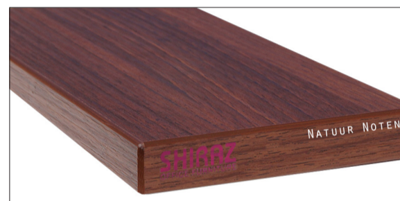
NatuurNoten voelbare structuur