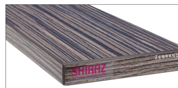
Zebrano voelbare structuur