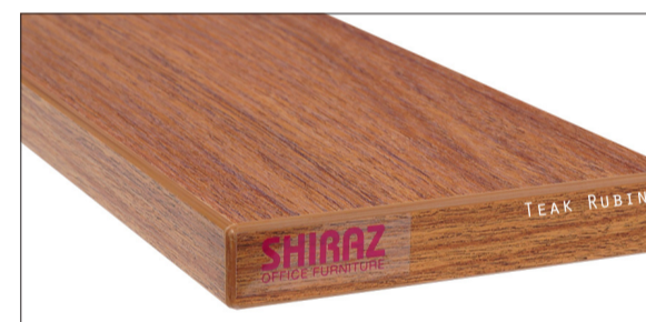
Teak Rubin voelbare structuur