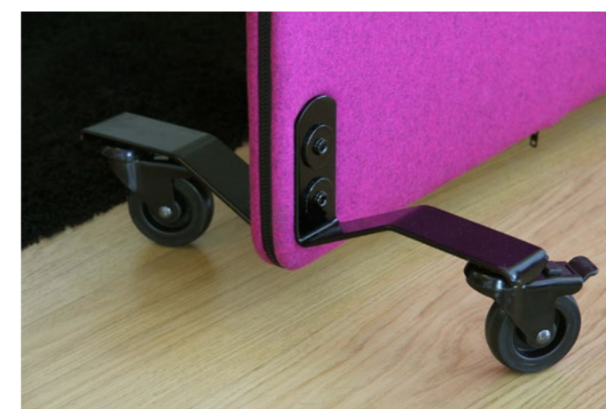
Voetenset met wielen