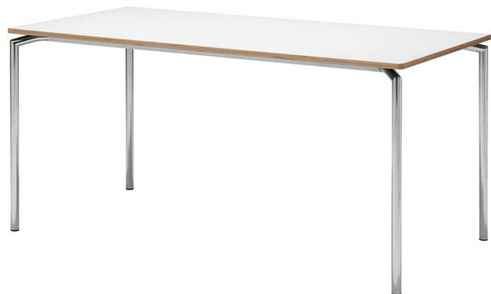
Kantinetafel Polo met wit tafelblad