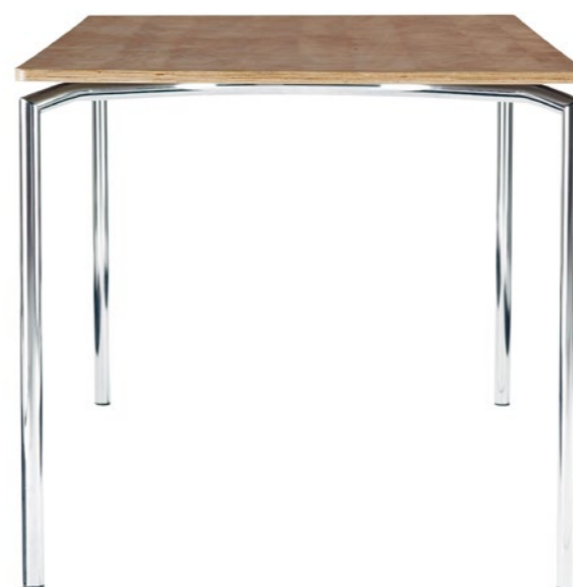
Kantinetafel Polo met kersen tafelblad