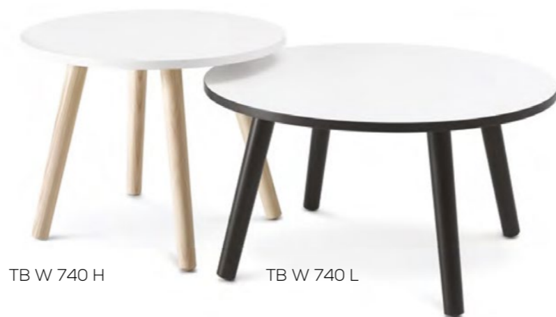
TB W 740 H