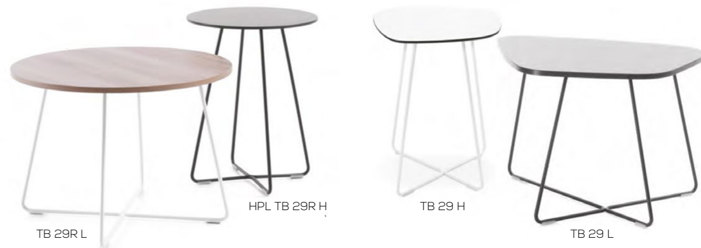
TB 29R L